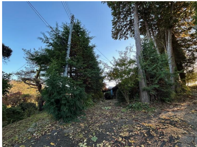
前面道路から望む物件