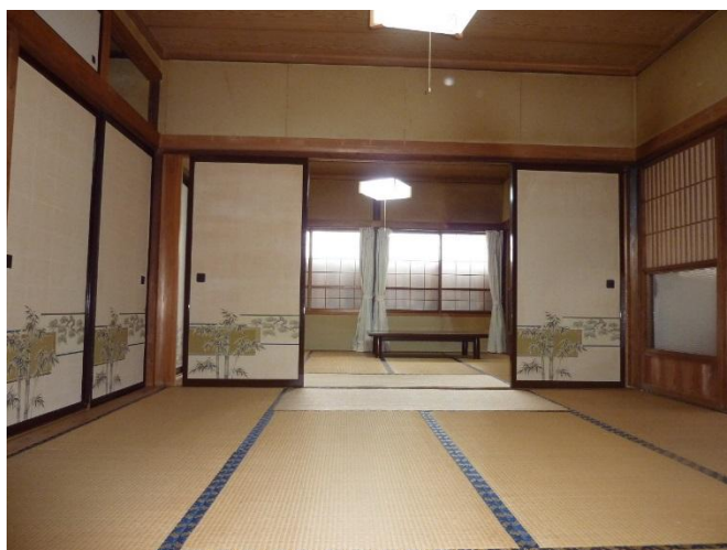
中間からの続き間