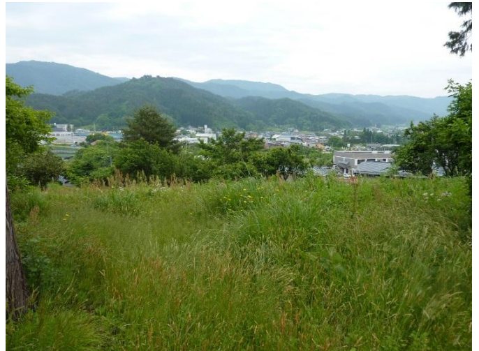
原野からの町の眺望