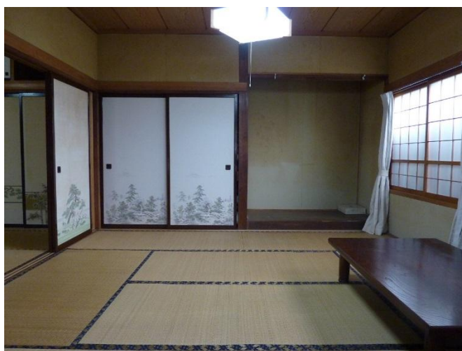
和室 8帖 (続き間)