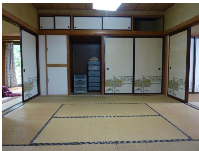
和室 8帖 (続き間・中間)