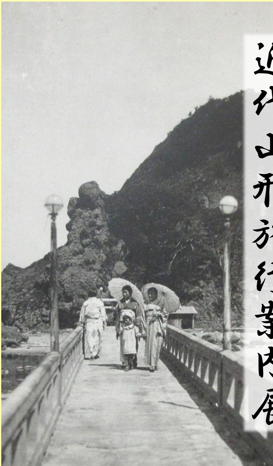
由良白山橋ヲ逍遙スル人々(部分)