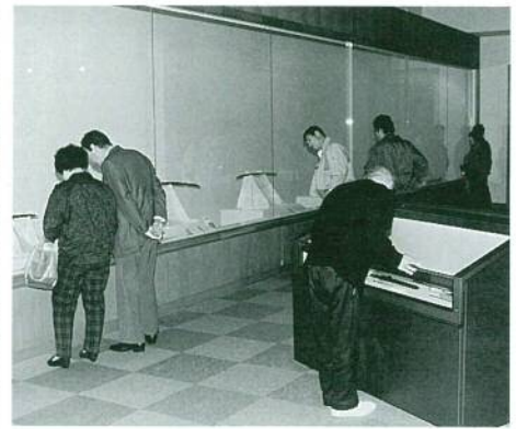
特別展の展示風景

これらの図録は、豊富な写真と共に詳細な解説が加えられたもので、ひとり参観に際しての便に供されたのみならず、墨跡展の図録等は館主催の歴史講座「戦国時代の手紙を読む」のテキストとして格好の資料となった。