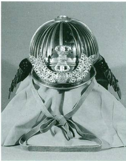
最上義光所用の兜（最上公義氏より寄託）