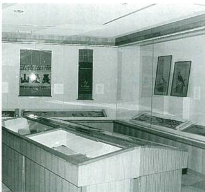
最上家名宝展の展示風景

過日上野の森(国立西洋美術館)のバーンズコレクションに立ち寄ったところ、数千の参観者が列をなして、入館するのにも何時間かを要した。列の中にあつて、はて文化の国際化とは何か、日本人であるわれわれ自身果して日本の歴史と文化にどれ程の関心と愛着とを持っているのだろうかとつくづく考えさせられたことである。それだけに歴史館に期待するものが大きい。