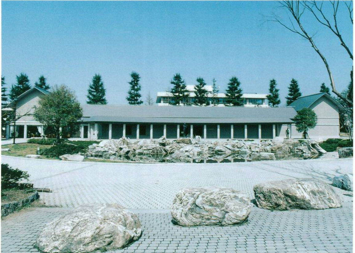
最上義光歴史館全景