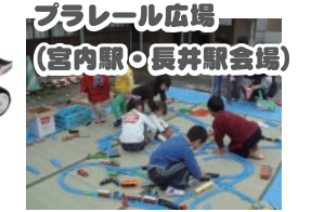
プラレール広場 (宮内駅・長井駅会場)