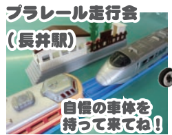
プラレール走行会 (長井駅)