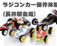
ラジコンカー操作体験 (長井駅会場)