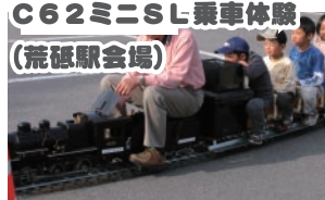
C62ミニSL乗車体験 (荒砥駅会場)