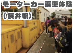
モーターカー乗車体験 (長井駅)