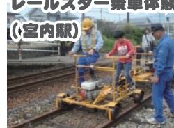
レールスター乗車体験 (宮内駅)