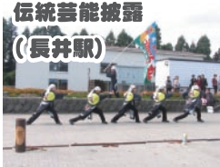
伝統芸能披露 (長井駅)