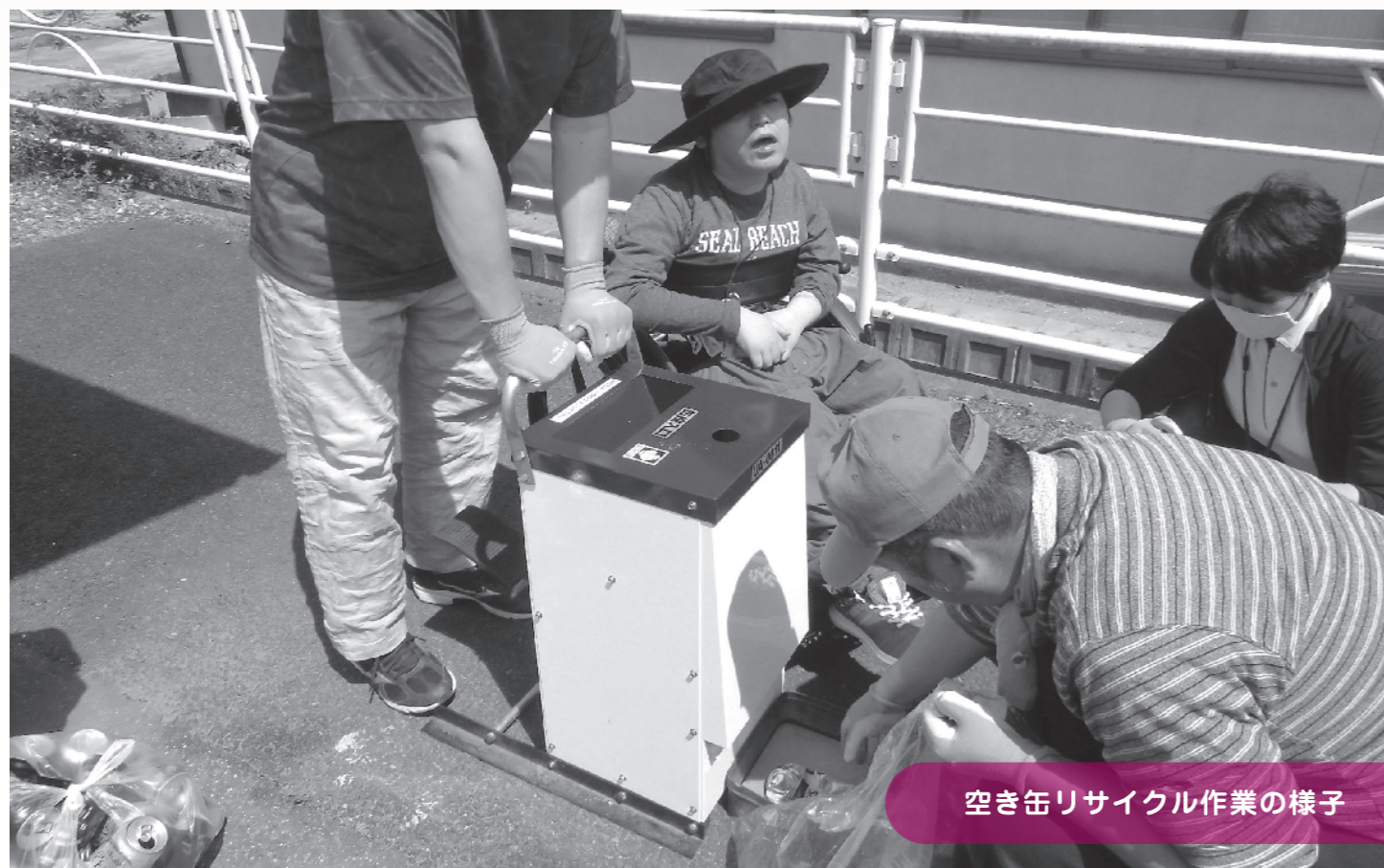
空き缶リサイクル作業の様子