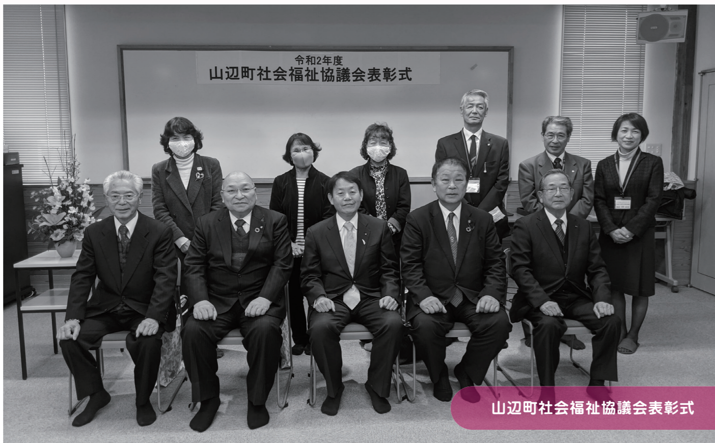
山辺町社会福祉協議会表彰式

今年度、コロナ禍により山形県民福祉大会並びに町福祉のつどいが中止となったことにより、令和2年12月14日に山辺町社会福祉協議会表彰式を行いました。