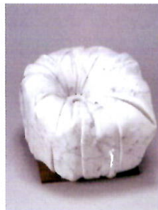
「季節のおくりもの」渡辺忍 1999年 大理石