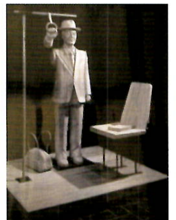
「バスの中で」阿部誠 1980年 木(彫)・ミクストメディア