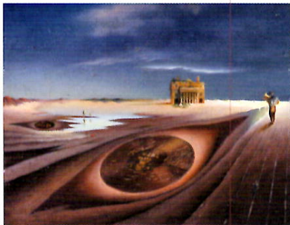
「オデオン」浜田浜雄 1940年 油彩・板

さあ、あまり難しく考えず、まずは作品の前に立ってみましょう。美術の世 界がググッと近づいてくるはずです。