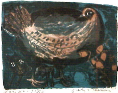
「大きなめんどり」田島征三(鈴木晋コレクション)