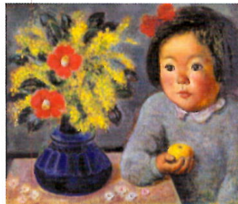
「彩子とミモザ」橋貞雄 1954年 油彩・板