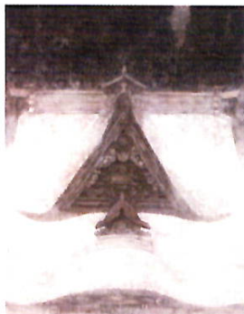
「白明」高橋誠 2009年 紙本彩色