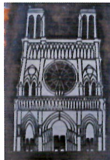
型絵染型紙 植夏子 昭和時代 渋紙・テトロン紗