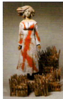
「記念撮影-鮫ヶ尾城-」 峯田敏郎 2004年 木彫