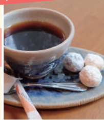
森の珈琲 手作り雪玉クッキー付