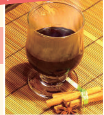
自家製グリユワイン