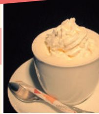
ウィンナーコーヒー