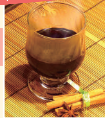
自家製グリユワイン