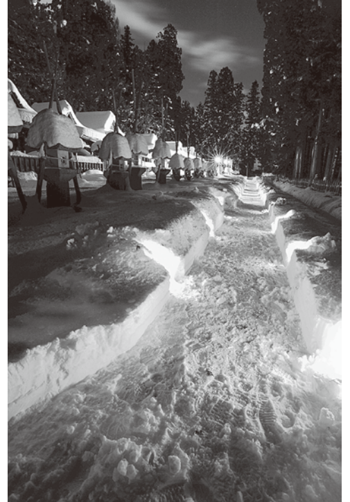
平成26年度 最優秀賞受賞作品 「とうろうあかり」(上杉雪灯籠まつり) 高橋 信弘 様

米沢は四季折々に多彩なまつりが開催されます。春の「米沢上杉まつり」、夏の「愛宕の火祭り」「花火大会」「獅子踊り」、秋の「なせばなる秋まつり」、冬の「保呂羽堂年越し祭り」「上杉雪灯籠まつり」更に地域には伝承される多彩なまつりがあります。そんな米沢のまつりを対象に写真コンテストを開催します。多数のご応募をお待ちしています。