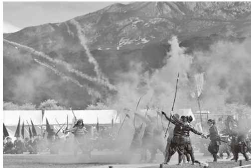
平成25年度 グランプリ受賞作品 「朝霧を貫く一斉射撃」(米沢上杉まつり) 田代 貢一 様