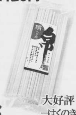
大好評 帛 —はくのきぬ— 特価 ¥185