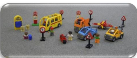
レゴブロック初お目見えの車と道路標識も大活躍♪

4月6日土曜日に研修室にてパパサロンが行われました。この日に、レゴブロック初お目見えの車や道路標識、色とりどりのカプラ、積み木を部屋いっぱい広げて待っていました。すると、早速、初お目見えの車を男の子が見つけて部屋中をめいっぱい走り回っていました。カプラのコーナーでは、タワーを作っているパパが慎重に慎重に積み上げている所へ車を走らせている男の子がブーン“あーっ！”という間にパパの作っていたタワーへ突入！タワーは、崩れ落ちてしまいました。あれっ、崩れ落ちる音が心地よく聞こえます。いい音がしました。カプラの木の優しい音です。こちらでも、丸い建物ができています。すると、またまた車がやって来ました。“あーっ！”という間にこちらも崩れ落ちてしまいました。「台風だあ」と言いながら、作っては壊しを繰り返して少人数ながらもぎやかなパパサロンになりました。