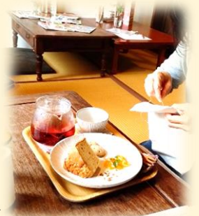
前回のちくちくの様子→