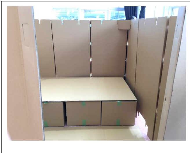
▲避難所用パーティション（仕切り）とベッド