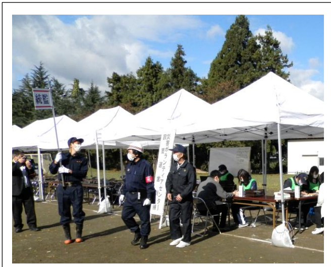
▲災害ボランティアセンター設置訓練

10月24(日)、豊田小学校を会場に「令和3年度長井市総合防災訓練」が開催されました。新型コロナウイルス感染症の拡大防止のため、昨年に続き規模を縮小しての実施となりましたが、参加者は緊張した面持ちでそれぞれの訓練に臨んでおりました。