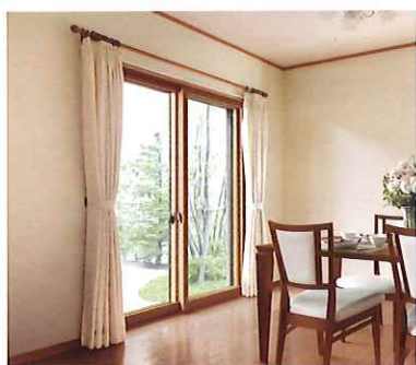
断熱内窓 (二重窓) インプラス

今ある窓の内側に新しい窓を取付けるだけ。1窓最短1時間のスピード施工で断熱性がアップして、結露も軽減します。