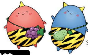
公式キャラクター たかつき&はたつき