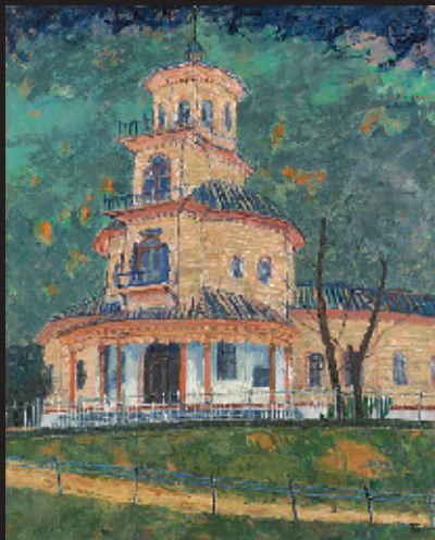
旧済生館 1987 第53回東光展