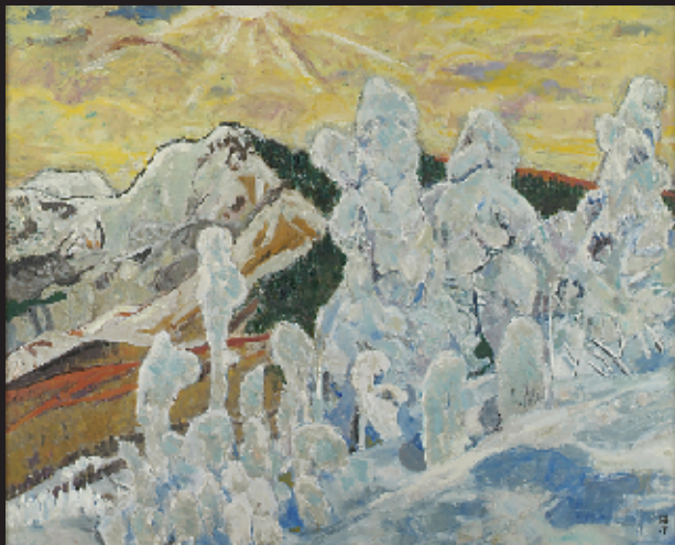
樹氷(蔵王) 1991 第23回日展