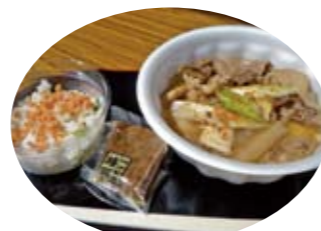
兼続どん丼まつり(イメージです)