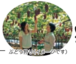
ぶどう狩り(イメージです)

●ワイン瓶詰めオリジナルラベル作成体験代金3,150円(5名様以上2,100円) (事前受付)、ぶどう狩り料金600円(事前受付)、昼食代金及びちよこっと試食・ガイド代金500円は現地でお支払いとなります。