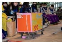
運搬に特化したアイテム例