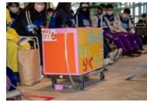
運搬に特化したアイテム例