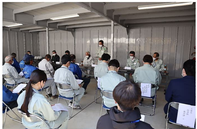
開会行事の様子（事務所敷地内にて）