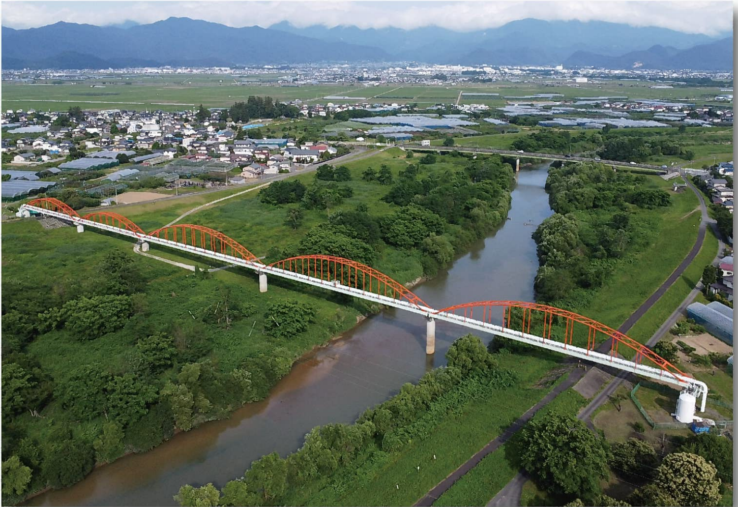
一級河川須川に架かる三郷堰水管橋 (最上川との合流部付近、真っ赤なランガー橋5径間)