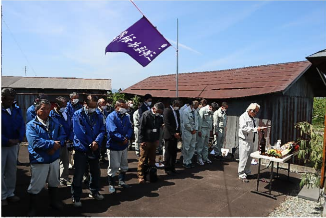
三郷堰土地改良区理事長による御祈禱

五月九日（火）、令和5年度三郷堰地域水神祭並びに通水現地観測会が行われました。今年は三年ぶりに、山形県村山総合支庁産業経済部長様をはじめ、農林技監兼農村計画課長様など多数の関係機関の来賓の方々からご参加いただき、開催いたしました。天候にも恵まれ、快晴の中、土地改良区事務所敷地内にある水神様に、今年一年無事に三郷堰の大地を潤すことが出来る事を願い、理事長が神事を執り行い御祈禱いたしました。近年頻発する豪雨による増水がないことも願いながら…。 その後、管内に通水を行い、現地観測会を水系単位に班編成をして観測を行い、水路のゴミなどを取り除きながら、管内全ての水路を確認しました。