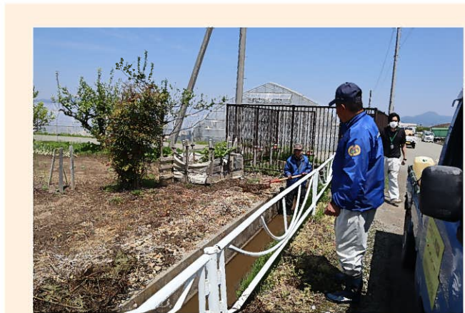
ゲート操作による水量調整及びゴミの除去