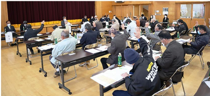
令和4年度通常総代会の様子

新型コロナウイルス感染症に加え、ロシアのウクライナ侵攻を始めたこと、国際情勢による原油や資材価格、電気代の高騰によりまして、コストの上昇のほか農業水利施設の維持管理費用の増大など、大きな課題に直面しています。 令和四年度は農業水利施設に係る電気料高騰対策として、国・県の交付金・補助金の活用を図り、土地改良区運営にとっても大きな成果となりましたが、令和五年度の状況においては更なる値上げが予想され、関係機関と連携を図りながら、節電節水に取り組みより一層の経費抑制に取り組んで参ります。 また、令和四年八月の記録的な豪雨災害をはじめ、自然災害は激甚化・頻発化しており、県内のいたるところで、農地・農業水利施設に甚大な被害が発生しております。 当改良区におきましては、最上川の異常出水により、揚水機場への被害が再び発生することが懸念されたところで、大事には至らず、安堵いたしました。日頃からの初動体制と災害への心構えを再認識したところです。再度災害防止のための組織体制の見直しを行い、防災減災体制の再構築を進めて参ります。