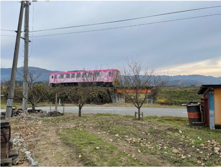
山形鉄道 フラワー長井線が近くを走ります