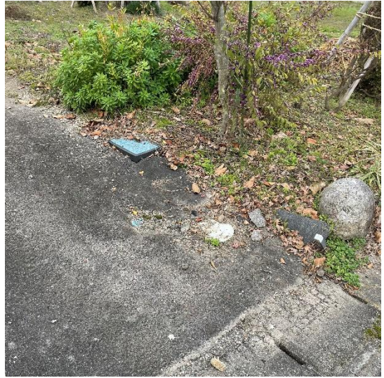
メーターBOX・止水栓