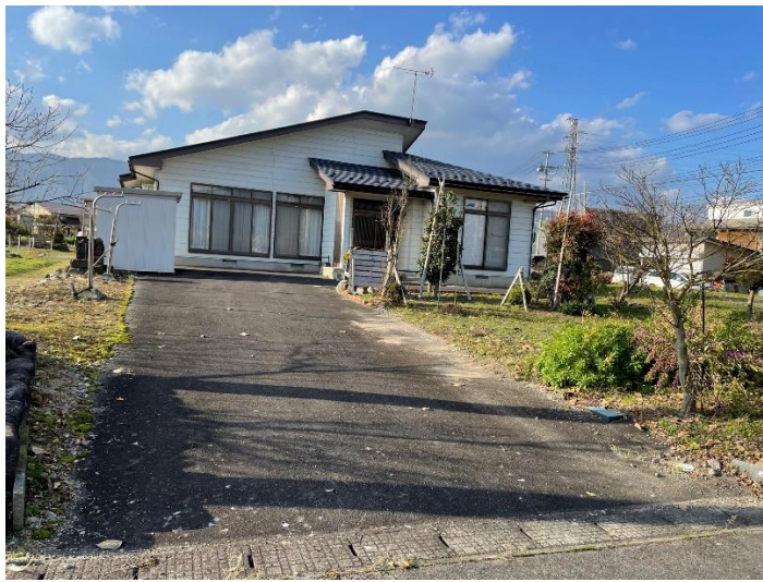
前面道路から全景