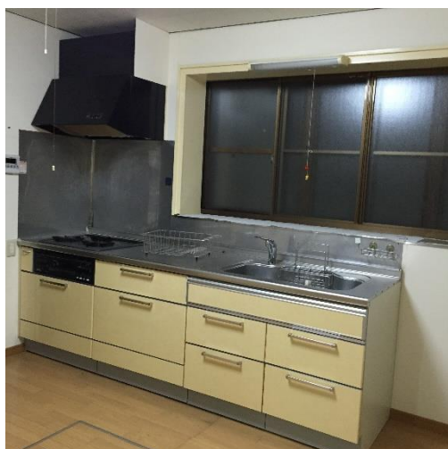
システムキッチン