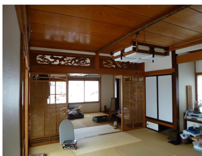
和室二間 ※現在荷物はありません