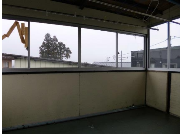
バルコニー ※屋根付きの物干しです