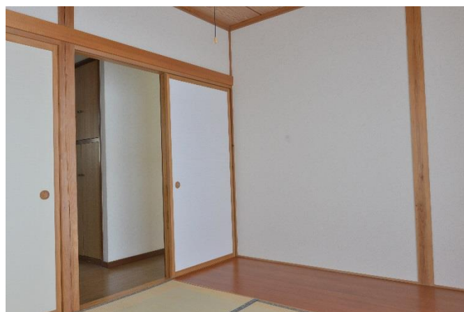
和室4.5帖+板の間1.5帖 (寝室)