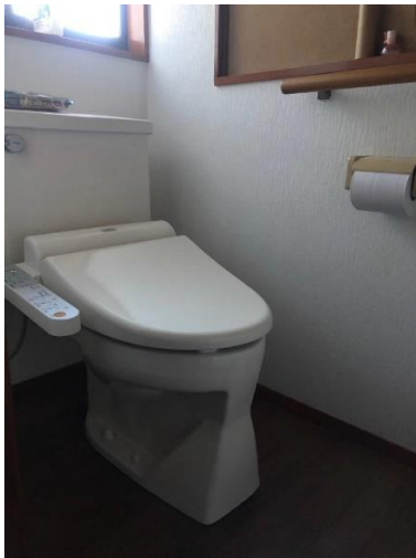
トイレ (大) ウォッシュレット付