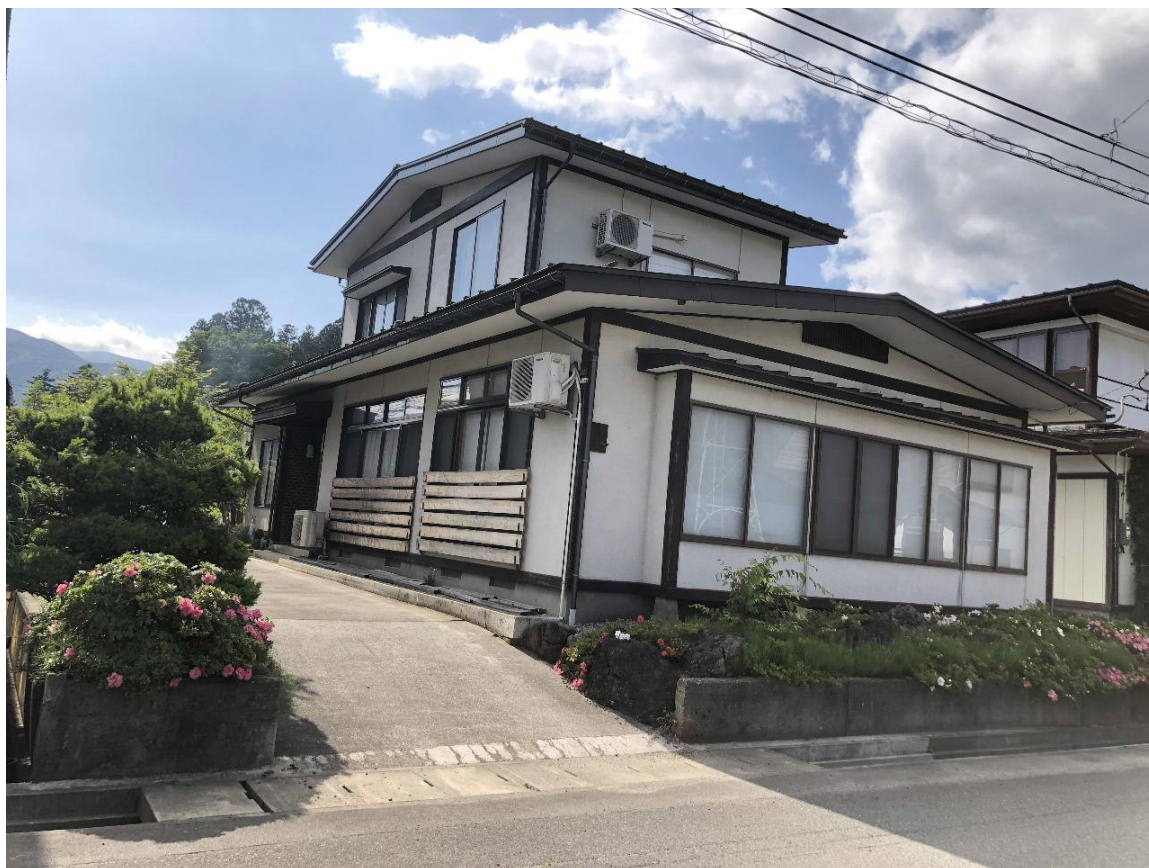
全景 ※前面道路も広々