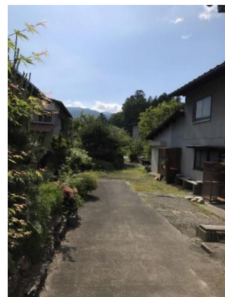
敷地奥が農地です