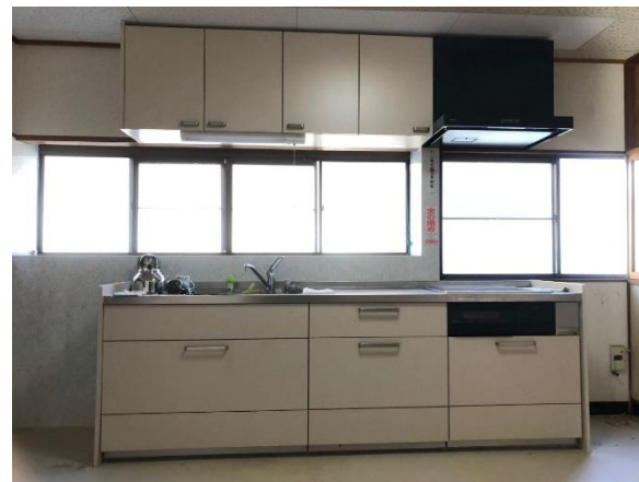
システムキッチン (IH)