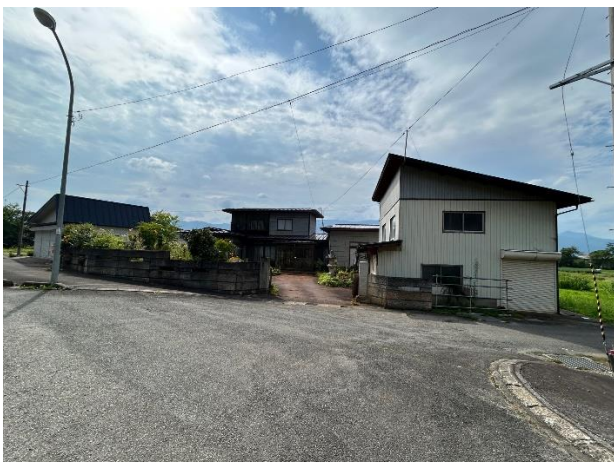
前面道路からの全景