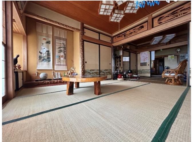
和室8帖（南西奥から続き間の様子）