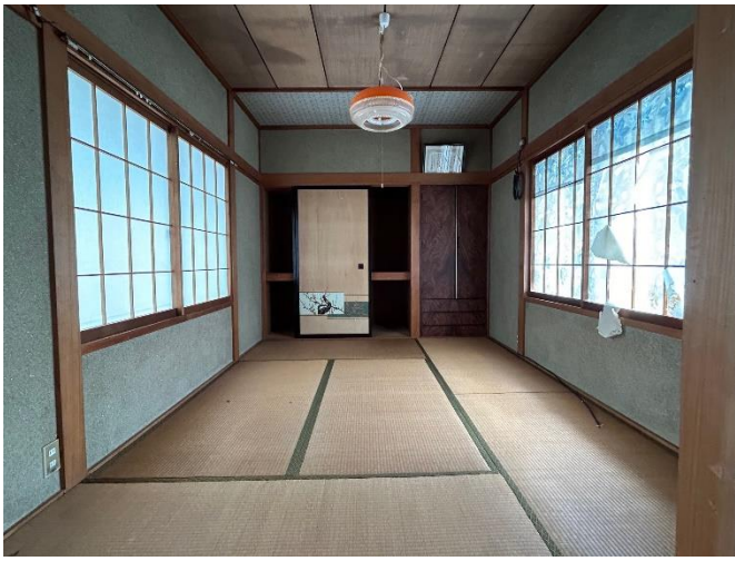
2階 和室6帖 (南西)