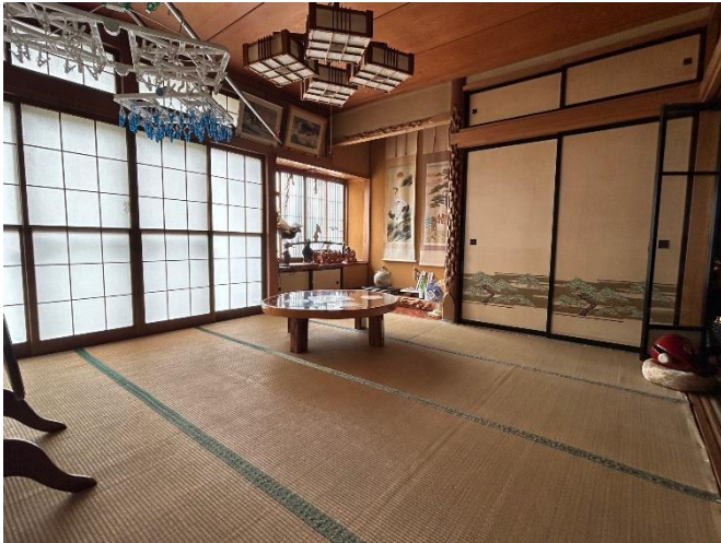
和室8帖（続き間 南西奥）