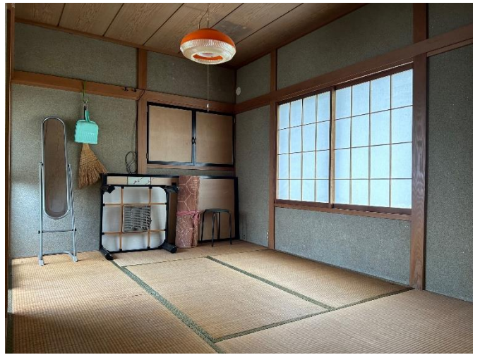
2階 和室6帖 (北東)