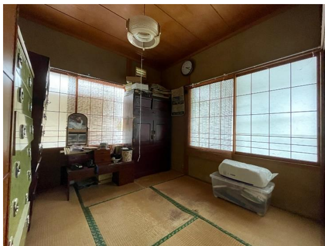
和室 4.5 帖