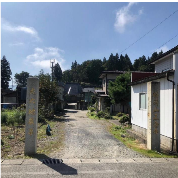
前面道路は丈六地藏尊の参道です（地目は境内地）