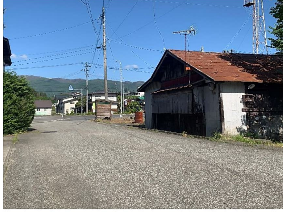
建物南側 町道の状況