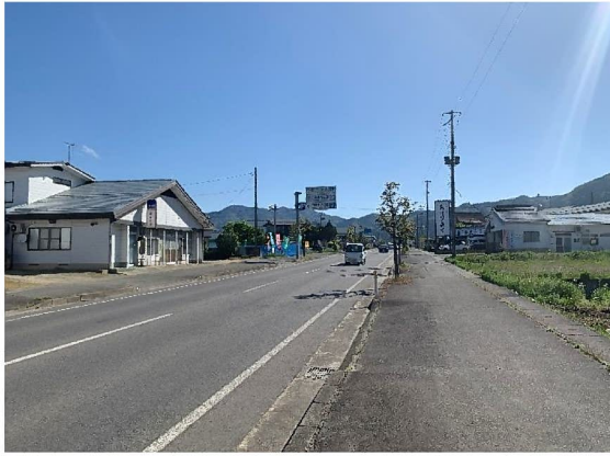
国道348号に出 北方面の状況