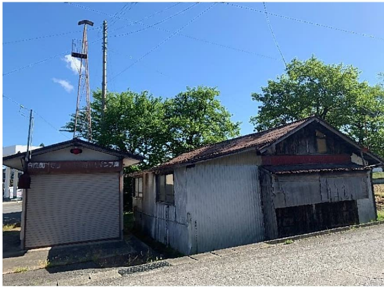
建物西側防火用地にポンプ庫