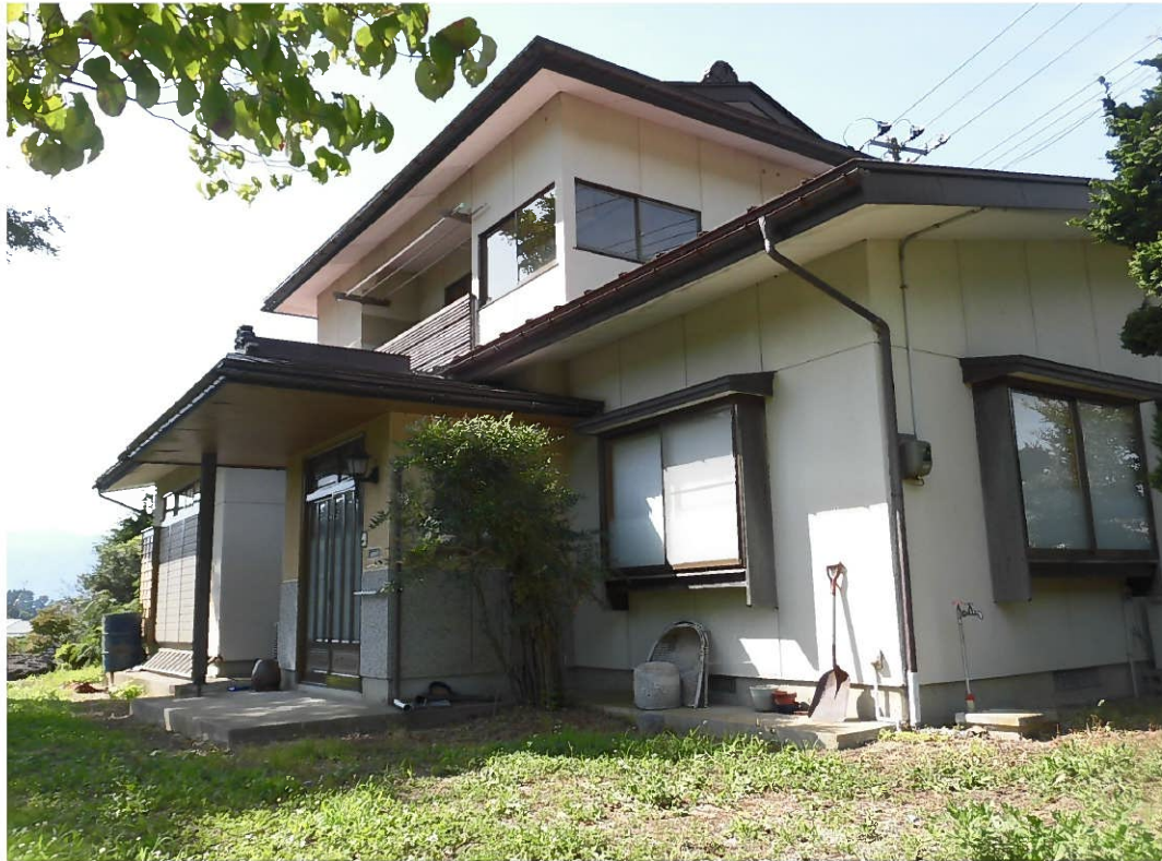
南側玄関で日当たり良好