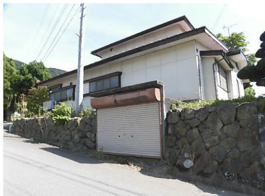
敷地の高さを利用した車庫