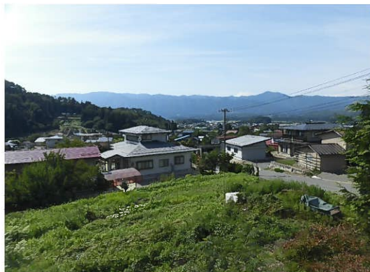
敷地西側から見た景色