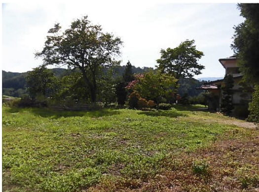
建物南側に広がる庭