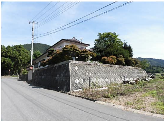
北西方面から見た建物