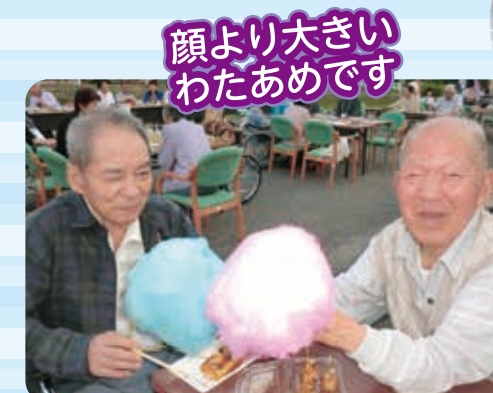
顔より大きい わたあめです