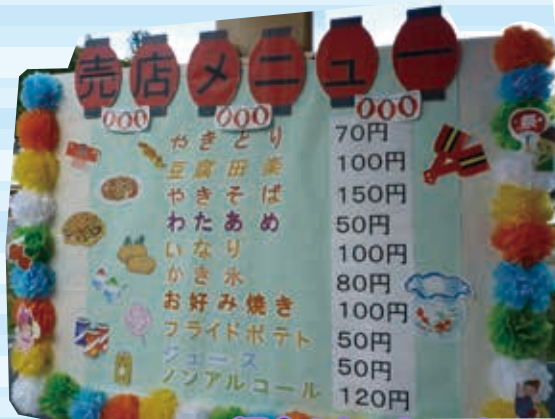
沢山の美味しいメニュー