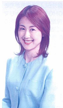
(株)キャラウイット 代表取締役 中小企業診断士

長野県生まれ。雪印ドール(株)マーケティング部等を経て、現在、横浜市で、小売店、商店街、百貨店、SC等幅広い顧客にプロモーション戦略策定支援、CSコンサルティング、人材育成事業を行う。全国の創業支援依頼に精力的に応じ、「楽しくわかり易い」と好評。著書に「社内コーチング導入マニュアル(同友館)」等多数。'07年日本商工会議所創業人材育成事業推薦講師。中小企業大学校講師(コミュニティビジネス創業支援など)。