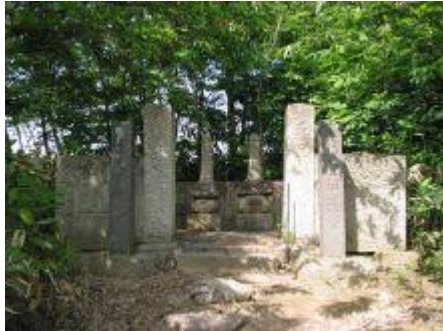
野手倉伊達家の墓

この屋代エリアはもう一人の政宗、9代政宗（儀山）を知るには格好のコース。9代政宗（儀山）は伊達家中興の祖と言われているとのこと。文武両道、知勇兼備はまさに政宗のDNA そのものだったんですね。