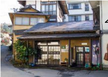
小野川温泉 吾妻荘

待ってましたー！ついに米沢牛のすき焼きにありつけることができました！おまけに歴史好きの主人の話が止まりません。すぐ近くで近年発見された天狗山館の模型を見ながらの伊達政宗愛にあふれたレクチャーに時を忘れしました。