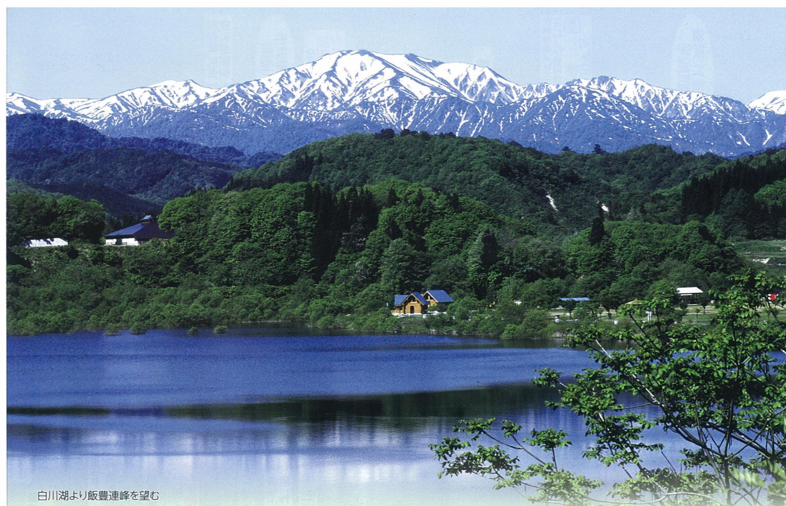
白川湖より飯豊連峰を望む

第38回 うけつごう 緑の大地 羽ばたこう ぼくらの未来へ 全国育樹祭 平成26年 秋季開催