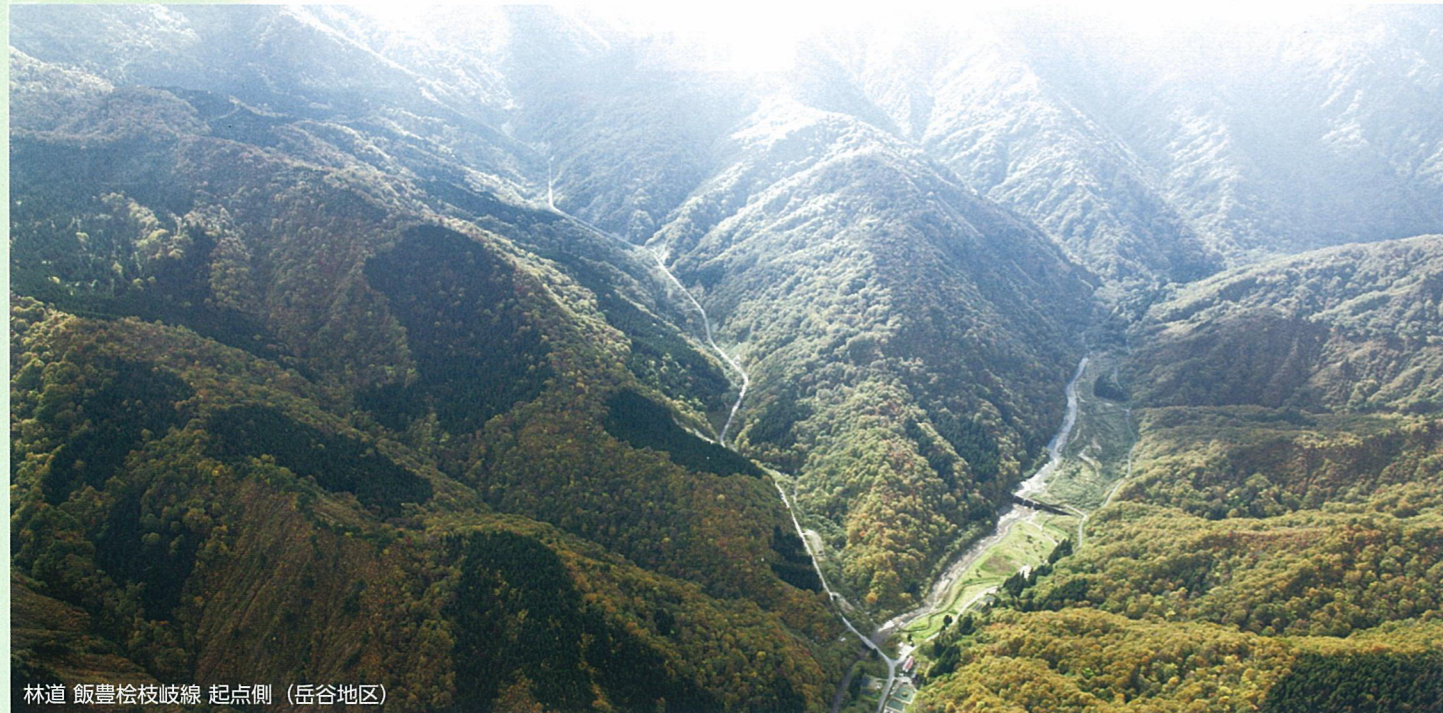
林道 飯豊桧枝岐線 起点側 (岳谷地区)

林道飯豊桧枝岐線・一の木線は、昭和53年度から平成24年度まで34年の歳月をかけて工事が完成し、山形県と福島県を結ぶ総延長13.8kmのルートが平成25年6月15日に開通します。