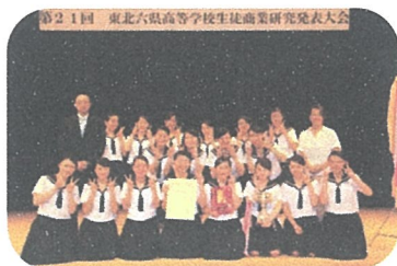
山形市立商業高等学校 産業調査部