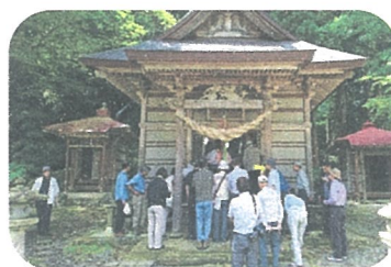
西川町歴史文化学習会