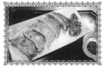
グランプリ 赤湯温泉青菜漬け餃子/ 酒房柳生の庄

南陽市の目玉となるご当地B級グルメを開発して地域活性化につなげようと南陽市商工会が初めて企画いたしました。コンテスト出場の公募をしたところ14点の応募があり、書類審査で10点に選考し、11月9日(木)南陽市交流プラザ蔵楽にて最終コンテストを開催しました。約230名の方が来場され、エントリーした10点を試食審査し投票して頂きました。グランプリは「酒房柳生の庄」がプロデュースした「赤湯温泉青菜漬け餃子」に決定しました。