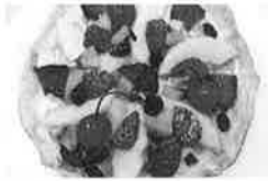
EST!のもりもりフルーツバリバリピッツァ/ Osteria EST!