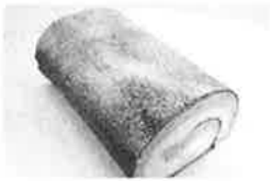
プレミアム南陽巻/萬菊屋