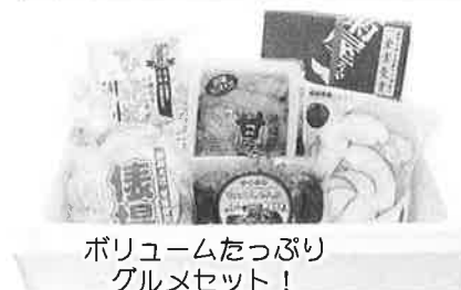
ボリュームたっぷり グルメセット！