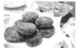
山形名物いも煮コロッケ/恵比寿&幹太郎