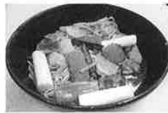
煮込みうどん/ひまわり産業