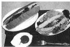
南陽の麺100%ソーセージ/どんぐり屋