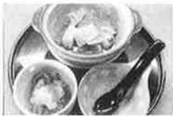
山々の山菜きのご鍋/山形和食佐辛