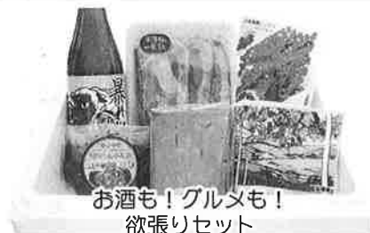
お酒も！グルメも！ 欲張りセット