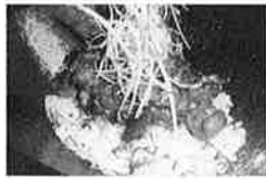
米沢牛スジ肉のワイン丼/肉の旭屋