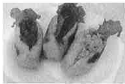
ホットきつね/野川食品