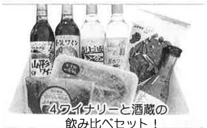
4ワイナリーと酒蔵の 飲み比べセット！