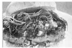
赤湯バーガー/スモークハウスファイン