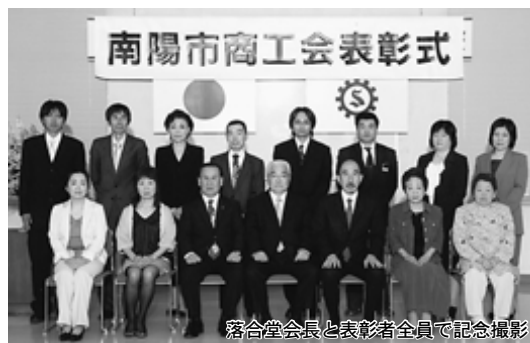
落合堂会長と表彰者全員で記念撮影