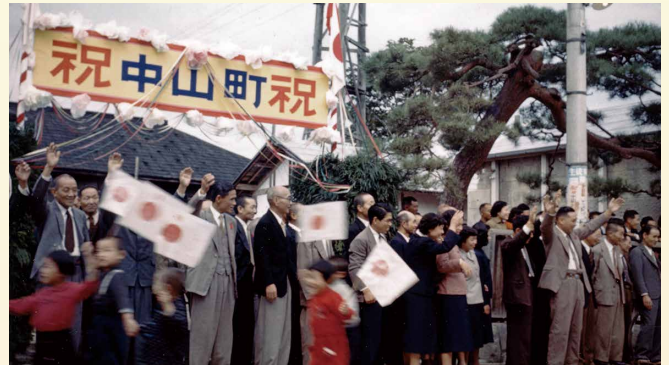
10月2日を「芋煮会の日」に制定 日本記念日協会に登録されました。 昭和29年10月 町誕生を祝う行列 「長崎町」と「豊田村」が合併。