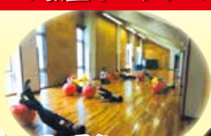
フェスタ・ バランスボール