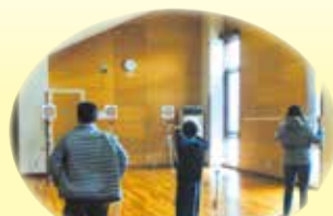
エンジョイ吹き矢教室