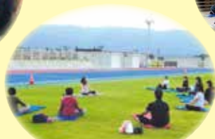
フェスタ・青空ヨガ