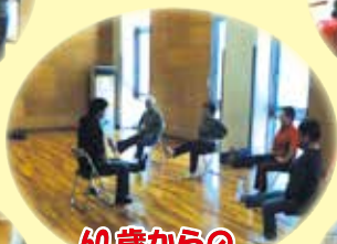
60歳からの 健康教室