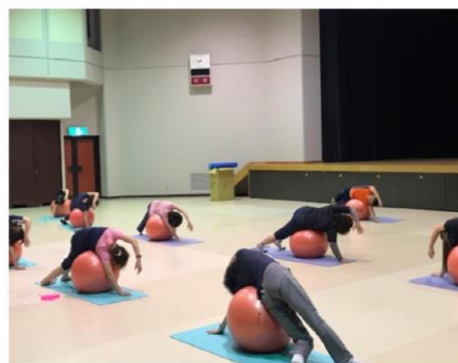
体幹トレーニング教室