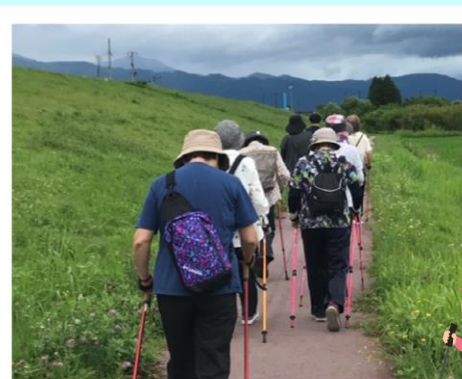
ノルディック ウォーキング教室