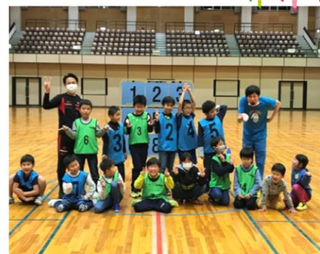
ピヨ卵ワイド ドッジビー取材