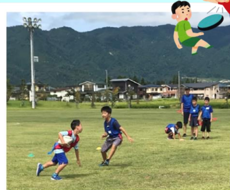
ジュニアチャレンジ タグラグビー