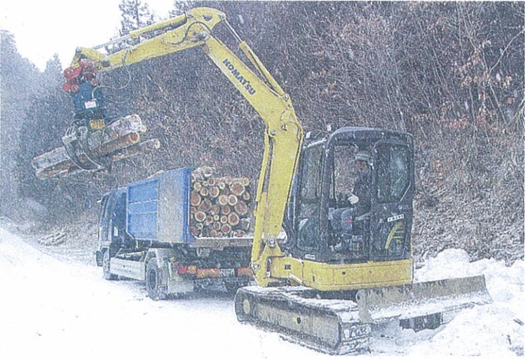
エネルギー供給モデル事業で間伐した木材をトラックに積み込む作業―紫波町山屋

モデル事業は林地残材を木質バイオマスに活用するため、紫波町山屋の山林所有者の協力を得て約4畝で実施。建設業の新分野進出を支援する盛岡地方振興局の補助金を受け、昨年九月