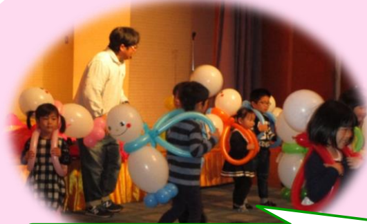
たけさんは、今年も走る走る！