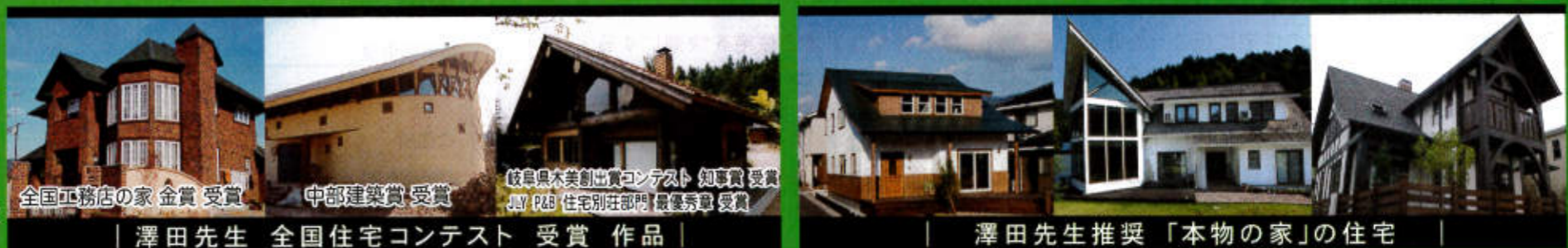
全国工務店の家 金賞 受賞 | 中部建築賞 受賞 | 岐阜県木美創出賞コンテスト 知事賞 受賞 | JULY P&B 住宅別荘部門 最優秀賞 受賞