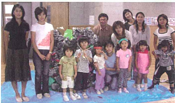
<だんごむし・あり>