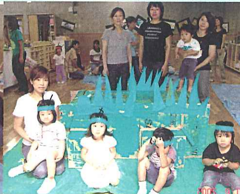
<かまきり・ぱった・こうろぎ>