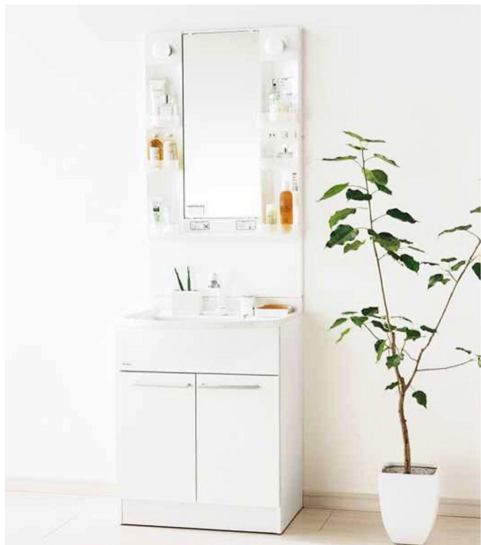
※写真はイメージです。組合せ・サイズなどはお見積書をご確認ください。