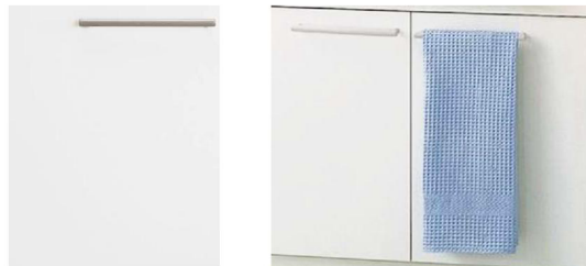
ホワイト 扉の開閉がしやすい幅広タイプの取っ手。タオルなども掛けられます。