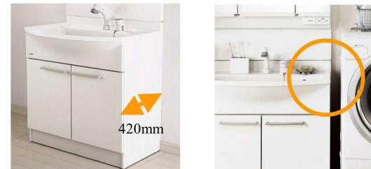
本体キャビネットは奥行き420mmのコンパクト設計です。 洗面ボールの成型精度が高いので、スッキリ納まります。