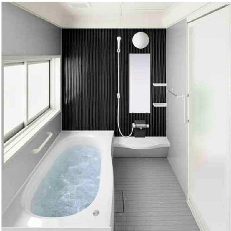
※上記画像はCGによるイメージ画像です。取付器具・機器の形状及び色柄などは実際の仕様と異なる場合がございます。ショールームなどで現物をご確認いただくことをお勧めいたします。