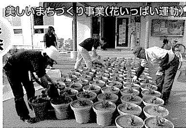
おいしいまちづくり事業(花いっぱい運動)