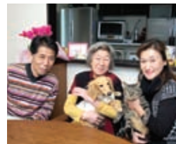
ご夫妻とお母様。元気に遊ぶ愛犬、のんびりくつろぐ愛猫も一緒に