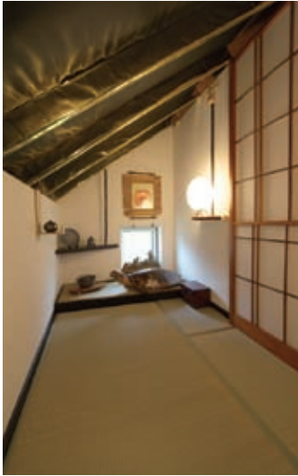
勾配天井にすることでデッドスペースとなる空間もA様の手には掛ければ有効な男の隠れ家に