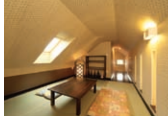
量フロアの小屋裏空間はもうひとつのくつろぎの場。気の合う仲間と居酒屋気分で美酒を満喫