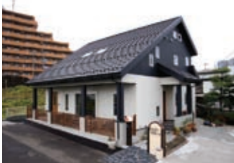
伸びやかなフォルムを描く大屋根の家。ウッドフェンスに囲まれたテラスはワンちゃんの遊び場