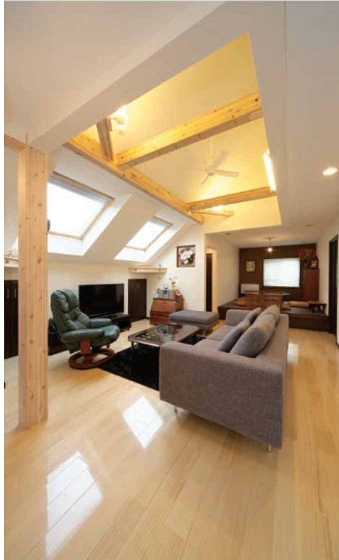
空間に奥行きを感じさせる勾配天井、夜には星空が楽しめる大きな天窗、シーリングファンから爽やかな風がそよぐ吹抜け、ご夫妻のために用意された心安らぐリビングスペース