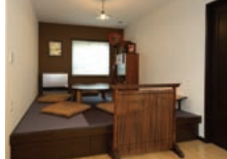
リビングの奥に配した小上がりタイプの和室。しっとりとした落ち着いた着きを奏でるデザインに