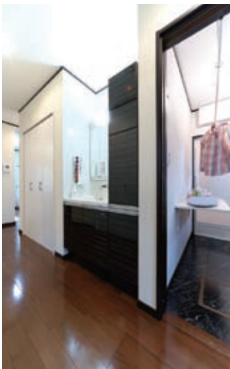
必要な場所に設けた機能的な収納や、アイロンスペースや洗濯物干しなど随所にこだわりが