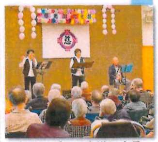
クローバーの会様による ハーモニカ演奏