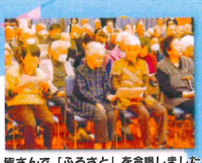
皆さんで「ふるさと」を合唱しました