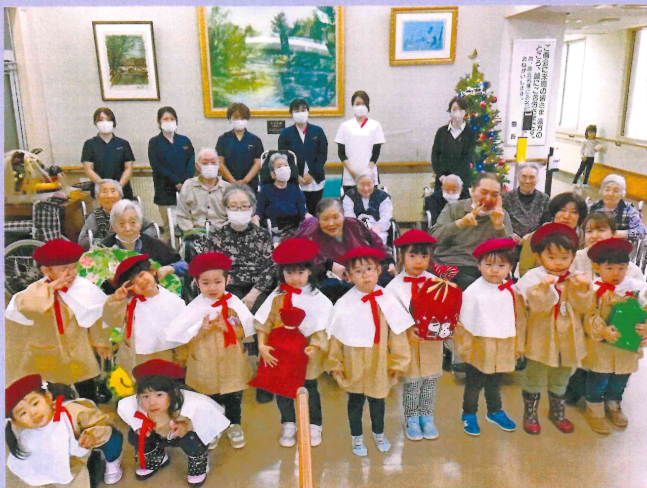
クリスマス訪問（白ゆり保育園様）