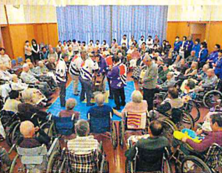
H28 仁陽会 もちつき