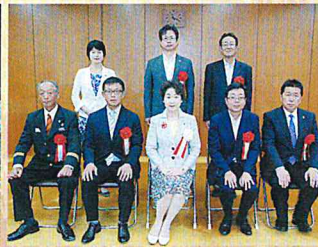
H29 献血厚生労働大臣感謝状 拝受