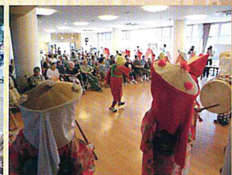
H26 伊佐沢小念仏踊り