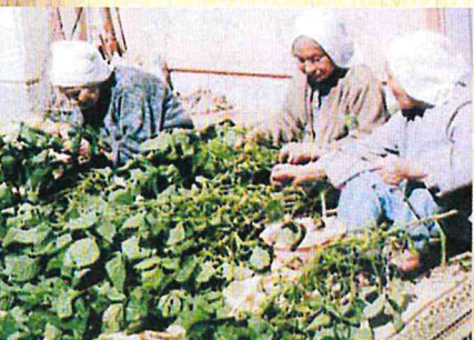
H9 趣味の広場 収穫