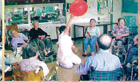
H19 作業療法士による集団リハビリ