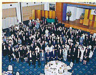
H26 職員の祝賀会(30周年)