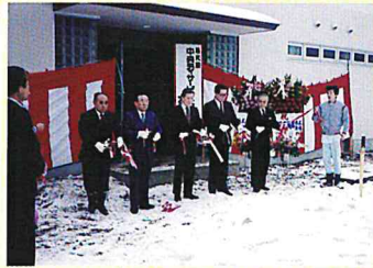
H3 中央デイサービスセンター開所式