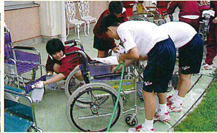
H17 長井南中学校「ラプリー長井」