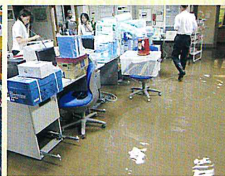
H25 豪雨により冠水したケアハウス