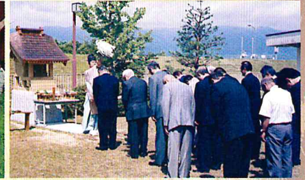
H16 慈光園八幡神社入魂遷座式