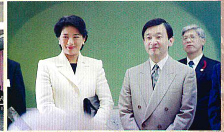
H15 皇太子、同妃両殿下行啓訪問