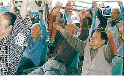
H18 介護予防体操(中央デイ)