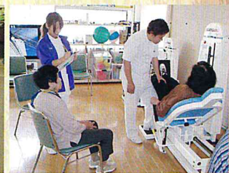
H24 慈光園リハビリ教室