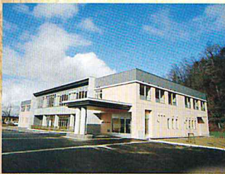
H23 竣工した新棟、新デイサービスセンター