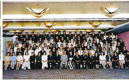
H15 ケアハウスウエルフェア慈光園竣工・慈光園20周年記念祝賀会