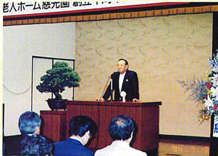
H6 創立10周年記念祝賀会