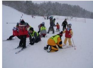
昨年度の様子です