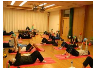
マルコンテンソー株式会社 労働組合福祉部様