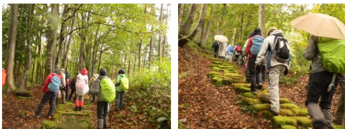
途中、大雨に見舞われました。