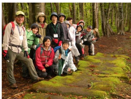
参加者13名と敷石道