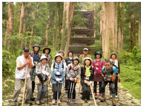
参加者12名 五重の塔を背景に