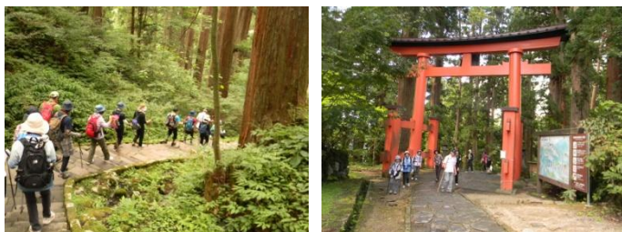
2446段の石段を登ります。