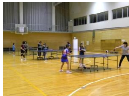
第4回(昨年度)のようす